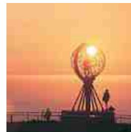
Sol da Meia-Noite

A Noruega é um país que encanta seus visitantes pela originalidade de sua natureza, pela cultura e nobreza de sua gente e pelo nível de desenvolvimento político-social, um dos mais altos do mundo. Da Aurora Boreal a cidades cosmopolitas, de fiordes magníficos a museus vikings, de arquipélagos singulares a vilarejos charmosos: tudo isso faz parte do fascínio que a Noruega exerce sobre os visitantes estrangeiros.