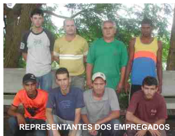
REPRESENTANTES DOS EMPREGADOS