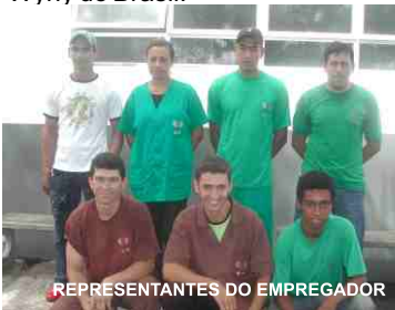
REPRESENTANTES DO EMPREGADOR

Desejamos aos novos eleitos uma excelente gestão e que possam contribuir para uma segurança ainda maior nos trabalhos da Wyny do Brasil.