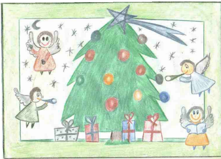
Cartão de Natal da Wyny

A todos desejamos um Feliz Natal e um abençoado Ano Novo.